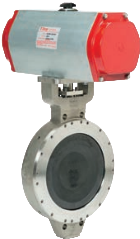
Metal Seated Wafer Valve

Bray offers a full range of electric and pneumatic actuators with accessories to meet your modulation and control needs.