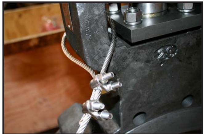
Figure 4: Wire rope secured around the neck of the valve.