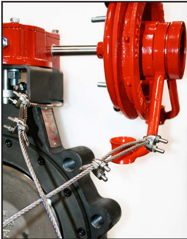
Figure 1: Wire rope secured around the bracket of valve and one "arm" of the chain guide.